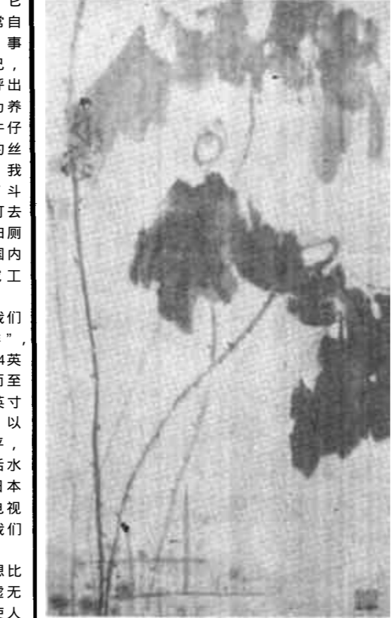
国画 任成文 本版编辑 珏 敬

大明伙着那张用镜框镶着的大红奖状骑着那辆半新的自行车满面春风地向家里走去。 进了那显得与周围辉煌建筑不协调但又极整洁的院子，没想到却遭到妻子彩凤的冷脸。 “哼！你心里还有这个家？”大明陪着笑脸：“有两个星期没回来了，心里确实急得慌。可初三毕业辅导，我实在脱不开身。功夫不负有心人，我教的班统考成绩列全县第一名，看，校团委又发给我一个大奖状。” “有钱吗？”彩凤两眼放着光。 “钱？钱倒没有，只是精神鼓励。”彩凤将那奖状冷冷一瞥，鼻子里又哼出一股冷气：“这年头，谁稀罕这东西，当什么当？” “这可是荣誉啊！” “哼！荣誉荣誉，民办教师干了十几年，奖状贴了一满墙，证书领了半抽屜，有啥来？还不是脱不了那一月不足一百的民办费。别猪八戒擦胭脂——自觉其美了。”说罢，不屑地扭回头去，顾自去翻每件衣裳的口袋和各个抽屉篋篋，她正为凑不足一袋化肥钱而着急。 彩凤在气头上，大明知一时和她解释不清，饿了，掀开锅找吃的。锅里只有半碗剩饭和一截生腌萝卜，大明心里一阵发酸。 晚上上了炕，彩凤喋喋不休，语气也咄咄逼人：“还是那句老话，辞职不干，到他姨夫的建筑工程公司去干会计，顶个一月也挣个三四百的。再干这一月不足一百的破民办，一家人老的老，小的小，弄不好要喝西北风。” “我还得继续干。”大明囁囁着：“我觉得总会有转正的机会。” “哼！名额下来了，三猫瞪着六只眼，鸡年狗年轮着你。一句话，辞职不干，路有千条，何苦在一棵树上吊死。”彩凤语气强硬，一脸的没商量。 大明被呛的无言可答。沉默了一会，探手去摸彩凤的脸儿，意在缓和一下僵僵的气氛，没想到彩凤一把推开了他，一下背过身去发声道：“上一边去，不答应你，别想再靠近我。有本事咱俩井水不犯河水，你领着两个老的老独过，我领着孩子单独过，你走你的阳关道，我走我的独木桥，谁也别拖累谁。”